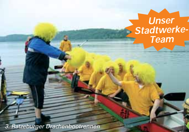
3. Ratzeburger Drachenbootrennen

Tipp Fluorid- Auf die Menge kommt's an Für Eltern mit kleinen Kindern ist der Wert des Fluorid-Gehaltes des örtlichen Trinkwassers wichtig. Bei Säuglingen und Kindern in den ersten Lebensjahren kann auf zusätzliche Fluoridgaben verzichtet werden, wenn das Trinkwasser zwischen 0,3 und 0,7 Milligramm Fluorid pro Liter enthält und die Flaschennahrung damit zubereitet wird. Enthält das Wasser mehr als 0,7 Milligramm Fluorid, brauchen auch Kinder über zwei Jahren meist keine zusätzlichen Tabletten. Ob im Einzelfall dennoch eine Gabe von zusätzlichem Fluorid angebracht ist, muss mit dem Kinderarzt abgesprochen werden.